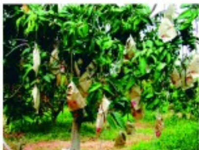
▲盒上標有紅線的黑色牛皮紙袋當作採收指標

‘金煌’芒果謝花後30-40日，果實約拇指大小，將無子果、畸形果、罹病果提早淘汰，能促進著果，亦可提高果實品質及加速成熟；疏果後配合套袋，能降低東方果實蠅、果斑病、炭疽病及蒂腐病危害，減少噴藥次數，降低農藥殘留的風險，促使果實外皮細緻光滑。套袋前先作病蟲害防治，然後再套上黑色牛皮紙袋，封口需確實密封，以防止雨水自袋口沿果梗流入袋內。