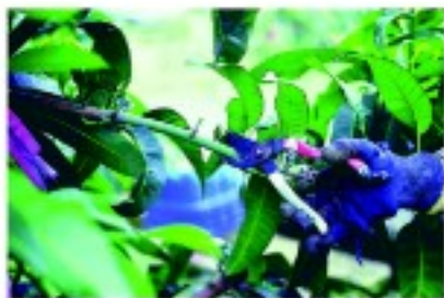
▲果實採收後，枝條回剪1-2次枝梢

‘金煌’芒果生長勢強，易造成植株徒長、枝條雜亂過密、日照不足、通風差，影響管理作業，病害發生較嚴重，使得開花少、著果低。因此，應砍除過密或矮化高大的植株，樹體每年也需做適度的修剪。一般在果實採收完畢，將結果枝回剪1至2次枝梢，切口不要在『節』上，避免長出過多的新梢，長出的枝梢若直立，可作水平式誘引。秋末冬初，疏剪過密的枝條，保持樹冠日照充足及通風，以培育健全的結果母枝，在翌年疏果時，將未開花、著果或罹病枝條剪除，但不宜過度修剪，需讓果實稍微遮蔭，將可使表皮較為美觀。