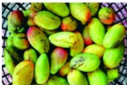
▲授粉受精不良的珠仔果