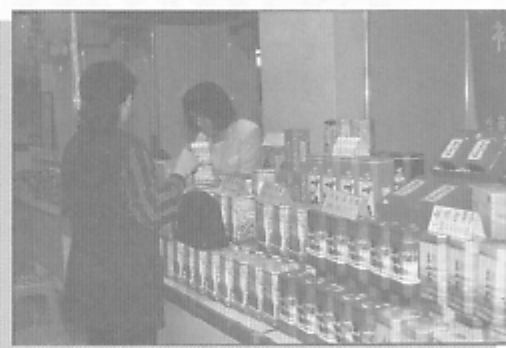
▲良好的茶葉包裝與明確的標示是保障消費者權益最直接的措施