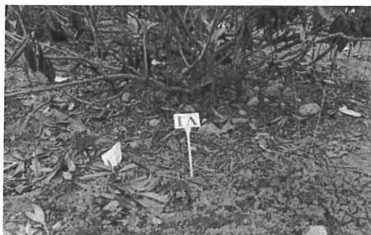
經年以果痕枝為結果母枝之栽培方式，造成樹勢弱化及枝條雜亂