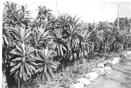
經土壤改良及合理施肥後，樹勢明顯恢復，有利結果品質的提升