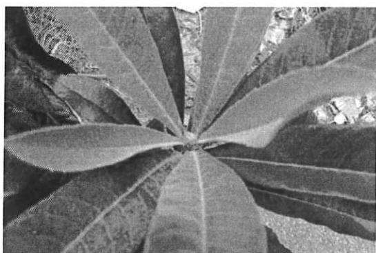
頂端停止抽梢時，應加強葉面磷鉀肥以促進花蕾形成