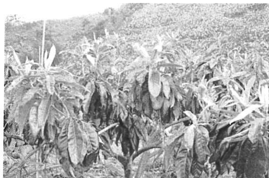
土壤劣化之果園其樹勢差，結果品質也不佳