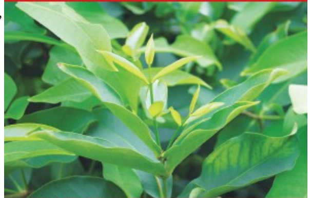
圖2.剛萌生之黃綠色新葉芽