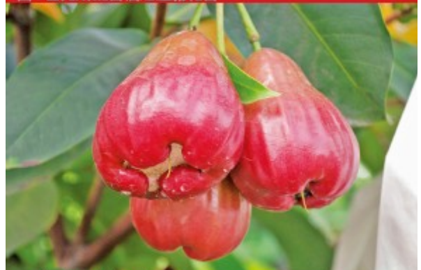
圖4.優質之成串巴掌果實