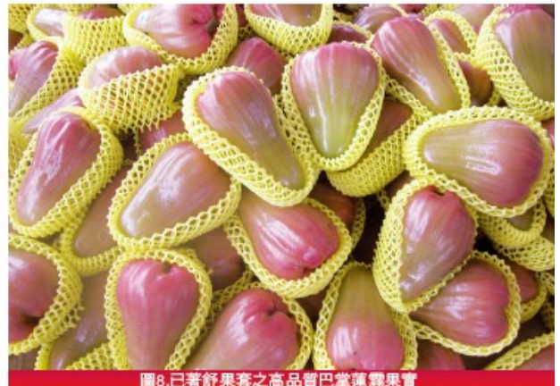
圖8.已著舒果套之高品質巴掌蓮霧果實