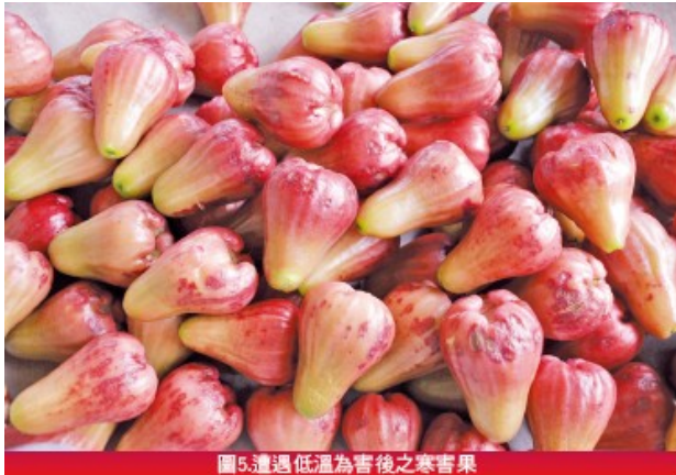
圖5.遭遇低溫為害後之寒香果