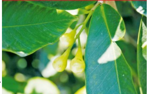
圖3.已完成疏蕾後之蓮霧花蕾