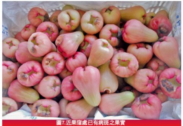
圖7.近果窪處已有病斑之果實