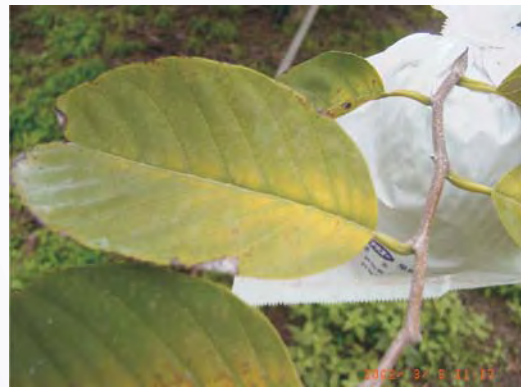
圖5-9 鳳梨釋迦葉片缺鎂，老葉之葉脈間有黃化現象