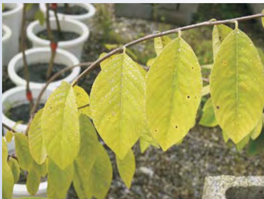
圖5-8 缺氮的鳳梨釋迦葉片新梢到枝條底部有漸層黃化現象