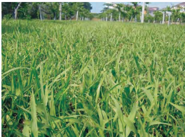
圖5-3 每年割刈5-6次，數年後兩耳草將成為果園優勢草種