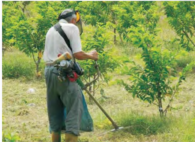
圖5-2 樹冠下不利乘坐式割草機行走，仍須使用背負式割草機除草