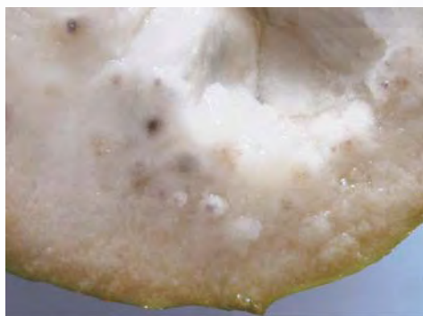
圖5-10 鳳梨釋迦缺鈣，接近果皮處之果肉可發現黑色異常粒狀物