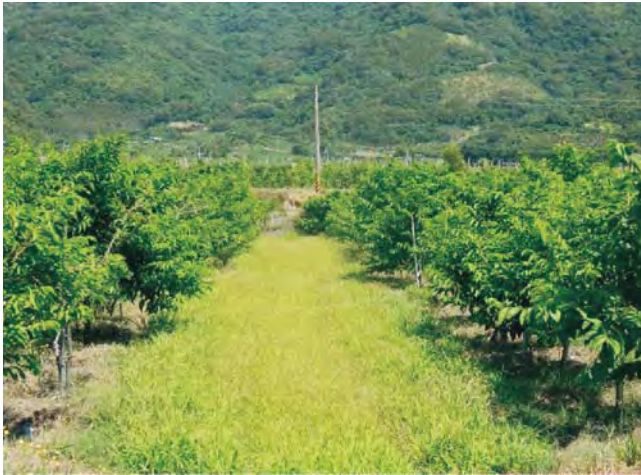
圖5-1 果樹行株距勿過密，整平且撿除石礫，使果樹行間方便以乘坐式割草機割草