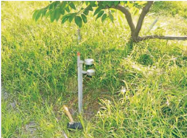
圖5-4 土壤水分張力計埋設深度分深淺二支，分別為30公分及60公分