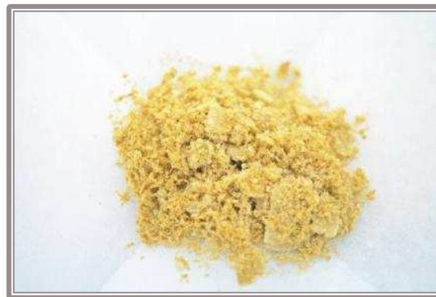
水酒萃枸杞葉即溶粉