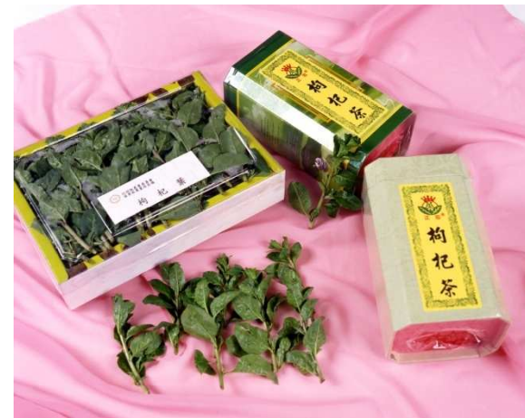
枸杞嫩梢及枸杞葉茶