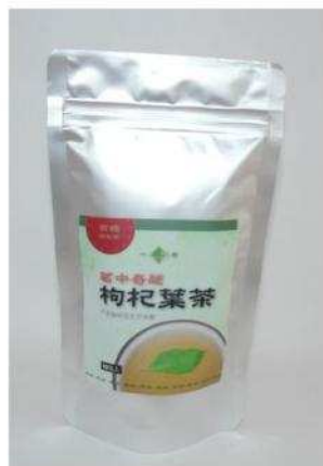
複方枸杞葉茶包(杞菊五加)