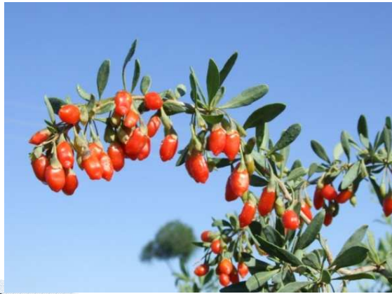
果用枸杞(寧夏枸杞)