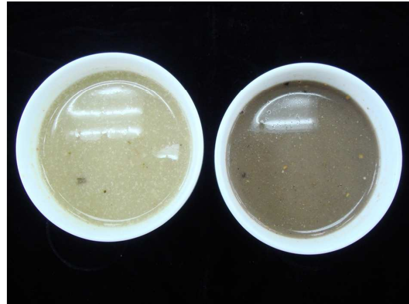
枸杞鹹粥(左)及甜粥(右)