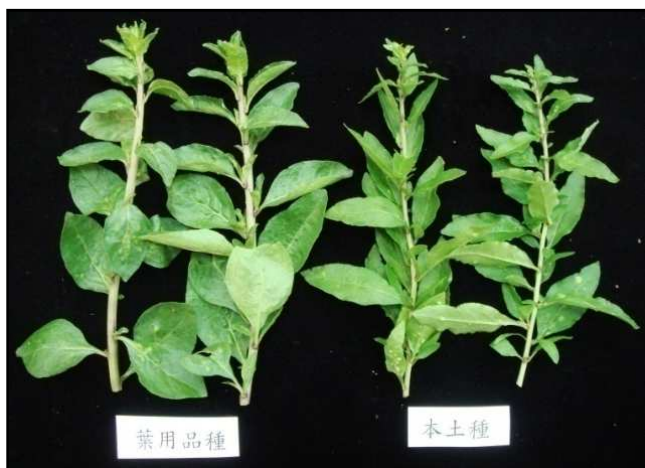
葉用種與本土種差異