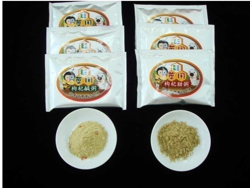
葉用枸杞沖泡餐包