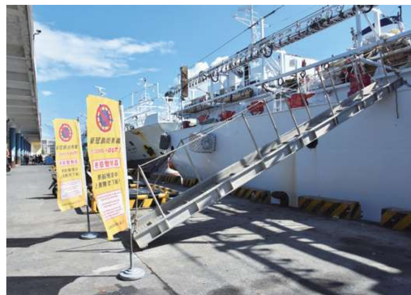
因應COVID-19疫情，遠洋漁船返港，全體船員進行皆須進行檢疫。

此外，在COVID-19疫情之下，以人力為主的監測、管制與偵查（MCS）措施皆有感染風險，因此已有更強烈的聲音呼籲使用電子觀察員等新科技，以確保漁業管理完善、海洋資源無虞。因此在國際上，我國亦應為可能出現的漁業管理轉變做出準備，特別是電子監控及電子回報方向。