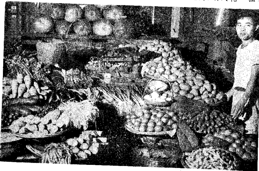
農復會計劃協助供應夏季蔬菜