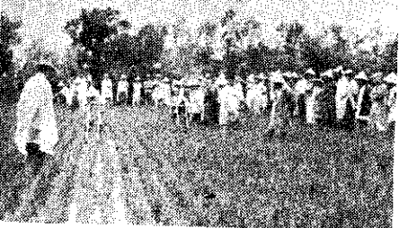
上：竹北竹北鄉農會改良除草機示範觀摩會(林祚賞) 下：竹北鄉農會改良除草機示範觀摩會(林祚賞)