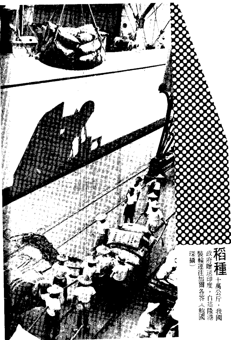
稻種 十萬公斤，我國政府贈送印度，自基隆港裝輪運往加爾各答。