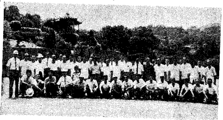
高雄縣光復農場代表赴中考察熟收及水保土特