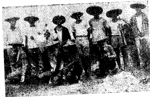
岡山鎮本洲里會員拔稈後留影 (蔡聰明)

助合作羣的生活習慣，特定於九月三十日起三天在新竹市南寮海水浴場舉行農業推廣教育露營大會。