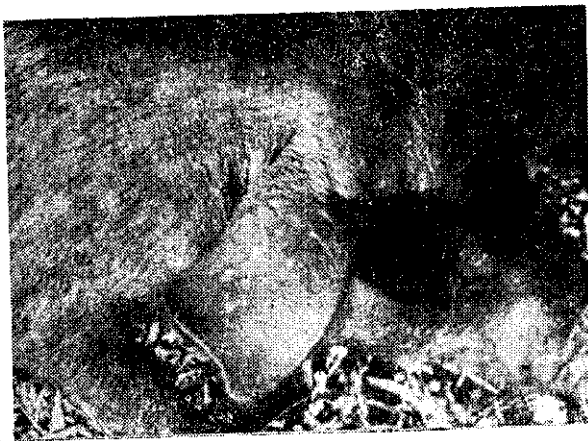
猪痘病徵（上：自然感染。下：人工感染）

因此，猪舍的環境衛生要作好，空氣要流通，污水糞尿要排除無阻。如有發生，可以注射青黴素，磺胺類等。避免發疹部份變化膿性細菌的混合感染而惡化，使猪隻早日恢復健康。恢復後即可獲得終身免疫。又發生時如能將發痘的猪隻即時隔離治療，避免感染到其他健康猪隻則更為妥當。