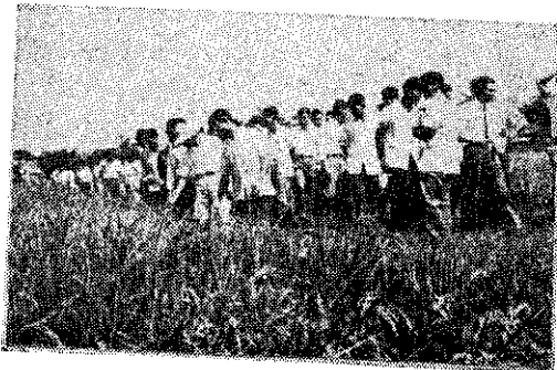
鹿草鄉農研班班員觀摩水稻優良品種(敬堯)

嘉義縣鹿草鄉農會為使農事研究班員採用優良農作物品種，以提高產量起見，特於(十)月十七日前往臺南區農改場嘉義分場及嘉義農業試驗分所實地參觀，以瞭解新品種特性，並分別舉辦講習會，參加班員有一百三十二人。(敬堯)