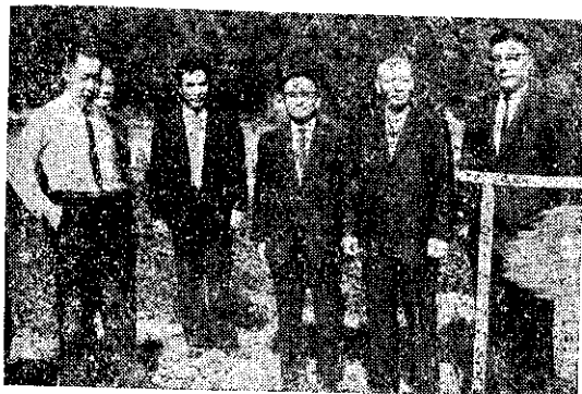
錦 葵 鍾

地。政府雖曾設法改良林相，以提高經濟價值，但因為經費困難，乃向聯合國提出申請，請予麵粉、麥、油等補助，作為部份工資，並由政府籌款配合，而於五十四年七月開始實施第一年的計劃。到今年六月底止，第一年內已如期完成了一千一百零六公頃的第一期林相改良。由於第一年的林相改良成績卓著，今年七月開始又繼續推行第二年計劃，面積為九百七十五公頃。