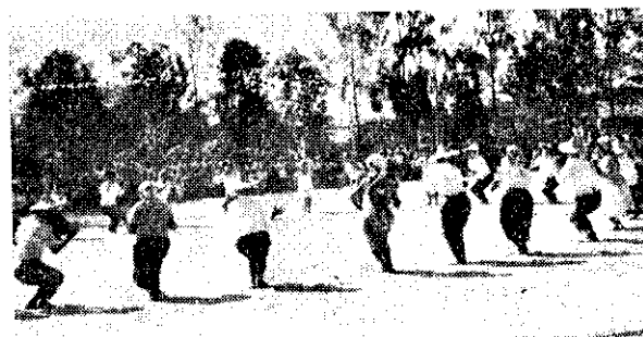
上圖：臺南縣官田鄉官田村家事改進班婦女，頭包紗巾戴斗笠，表演精彩土風舞。

在一般農村婦女中，一到三十歲皆認為自己是老太婆了，什麼活動都不好意思參加了，然而在該隊中却有五十七歲的班員，可是她們仍能合作無間，在優美的音樂聲中，歡樂起舞，甚獲地方人士的贊賞。（陳竹林）