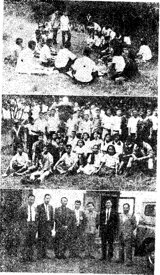
國韓在川吉許使大根草 外郊在友會韓與：中，戲遊體團做友會韓與：上 。影合員導首健四韓與：下，影合

邱指導員畢業於臺北縣立新莊農校五年制第二屆，其在農會從事四健會工作時熱心公益，貢獻頗大，甚獲各界好評。(劉貴德)