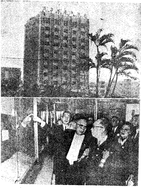
上：土地改革紀念館在台北市敦化路，落成於十一月一日。 下：農復會副總長參觀土地改革紀念館。

菸酒公署頃定本年度收購高梁以三萬噸為限。方面則希望為三六六元。二是收購量的超額或不足問題，局方定為百分之十，農會則要求放寬為百分之廿。