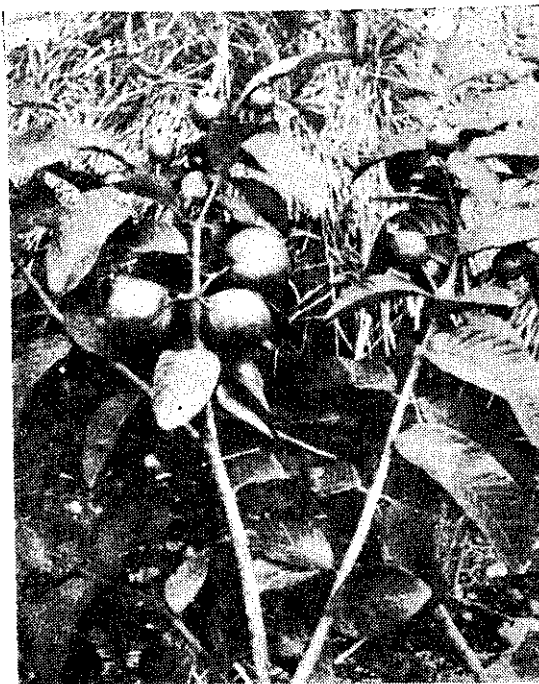
(蘭鴻東) 榴石番的好良生長房舍裏

目前番石榴大部份供作生銷，但亦可用砂糖或鹽水醃漬後供食，亦可製成蜜餞和果醬、果汁後食用。