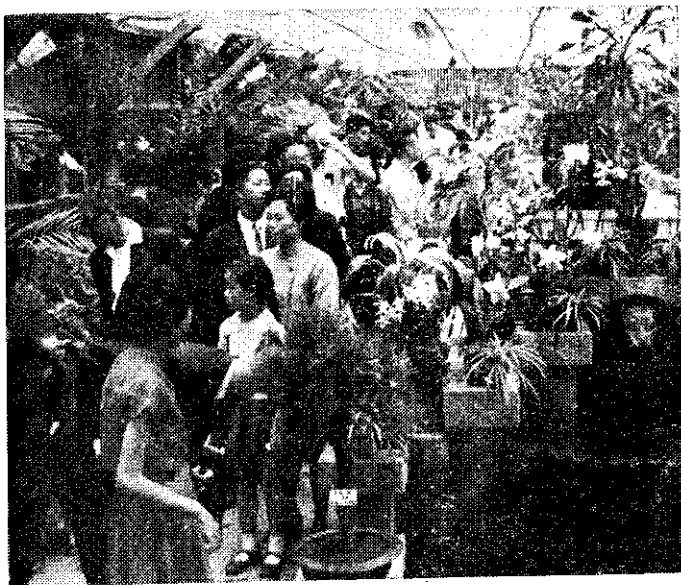
上：展覽會場參觀者絡繹不絕 下：場外附設服務部供應盆景