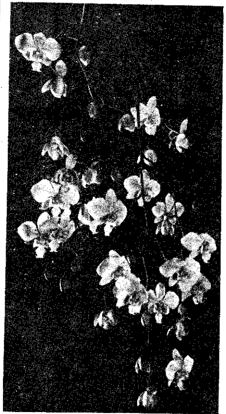
(朝義朱) 蘭蝶物蝶似花似

「蘭科植物」，聽起來好像有點兒專家氣，其實，不過是分類學上的用詞而已，簡單地，也可以說「蘭花」。