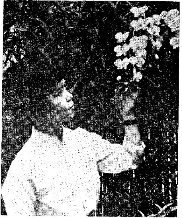
(美) 蘭蝶蝴蝶一產特灣臺的貴高雅清