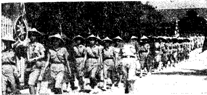
嘉義區各校徒步行軍行列(文秀)

高雄縣立岡山農校為鼓勵學生踴躍投考軍校，於上(四)月十四、十八日由教官領導分別參觀鳳山陸軍官校、左營海軍官校、岡山空軍官校。軍校的設備實是完善新穎，並參觀他們的射擊、儀隊、分列式閱兵等表演，每項都引起在場參觀的同學掌聲如雷，參觀過後會有不少同學說：「我非報考軍校不可。」(謝忠勇)