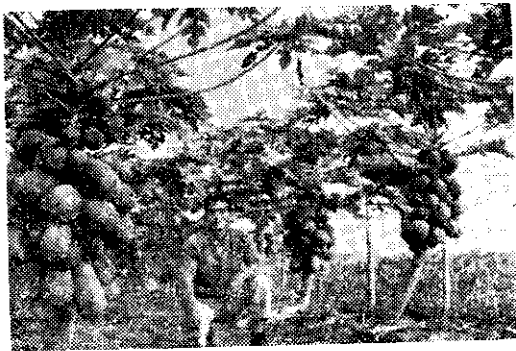
臺南縣後壁鄉嘉田村十四號稻田出農友育成的木瓜新種，栽培易，產量豐。

區開工作會報一次，以了解各地病蟲害詳情，同時由專家舉行專業訓練。縣市預測員所負的任務，除辦理規定工作外，並應隨時接受農林廳、農業改良場各種交辦事項，並應協助鄉鎮公所，農會指導農友適時防治病蟲害。各預測員時刻訓練自己，並接受上級各種專業訓練，不斷吸收新知識，同時巡迴調查其所轄小區，掌握各鄉鎮病蟲早期常發生地詳情，使農友均能得到病蟲害預測工作的成果。