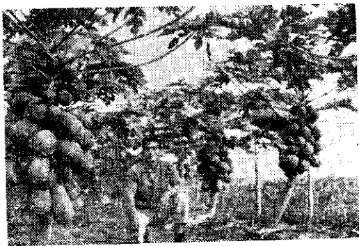
臺南縣後壁鄉嘉田村十四號稻丁出農友育成的木瓜新種，栽培易，產量豐。