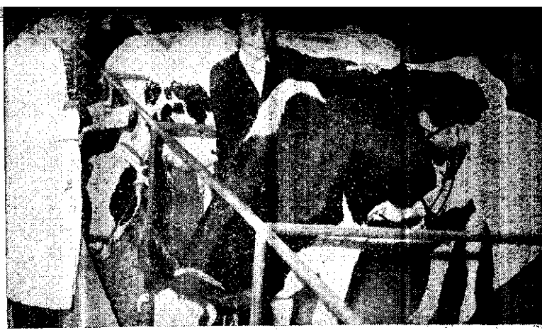
（供提得皆謝）形情康健查檢心小員人醫獸由畜家保委險保畜家

政府多年來除了倡導注重家畜品種，推廣改良飼養方法，並全面革新農友舊習慣，以科學技術教育農友外，並在四十九年間開始輔導農會兼辦家畜保險。凡參加保險的農友，對他所投入家畜事業的