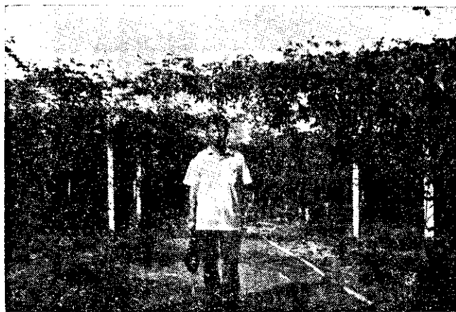
圖果果香百的場農山金