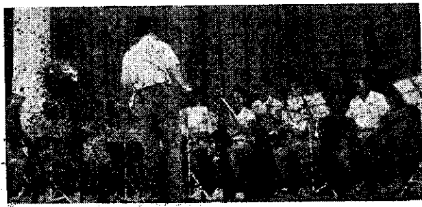
中壠高農康樂表演競賽—樂器演奏(廷安)

競賽結果：第一名高二班、第二名高三班、第三名高二班，初一仁班，優勝班級各由學校頒發錦旗、獎品以資鼓勵。(余廷安)