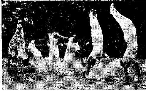
臺南農校課外運動之一(蔡)