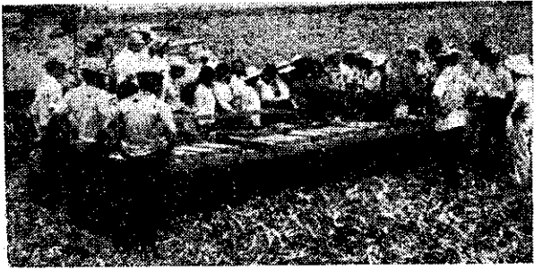
省立屏東農專參觀老埤農場情形(學文) 取該場張課長講解情形(學文)

省立嘉義農專全體同學為響應中華文化復興運動，並歡送應屆畢業同學，特於五月廿一日下午在該校大禮堂舉行班際康樂競賽，經評定後，選出優勝者廿五組，並訂於歡送畢業生同樂會中，舉行決賽。(李清水)