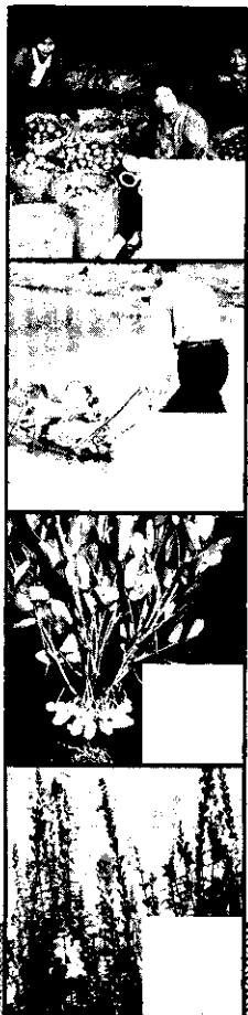
豐年有獎測驗印花 (第二號)