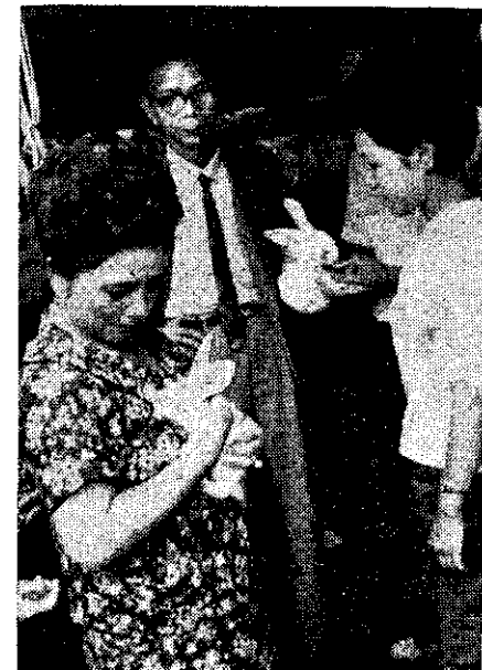
(英蕙徐房) 見養——業副利有家農地山

班班會是否充實有效，對山胞婦女的興趣與工作成效影響甚大。民政廳經常積極輔導班會開會內容充實，並規定各鄉家政指導員必須依照工作計劃，預定推廣教育項