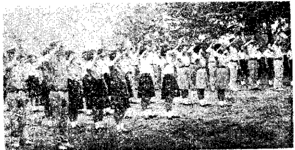
嘉義區露營舉行升旗典禮（玉）

嘉義縣學校區四健會，五十六年度六月份聯合活動，於六月八日由東石農校四健會主辦，舉行為期三天的聯合大露營，營地設在嘉義縣東石鄉鰲鼓村港口宮邊，有東石農校、民雄農校、嘉義家職、東石中學、嘉義農專等。活動項目有：①作業成果發表賽及烹飪比賽，②康樂晚會及電影欣賞，③環堤望海遊戲，④唱和跳，⑤自由交誼，⑥營火會，⑦模彩等，至十日下午三時圓滿結束。（玉）