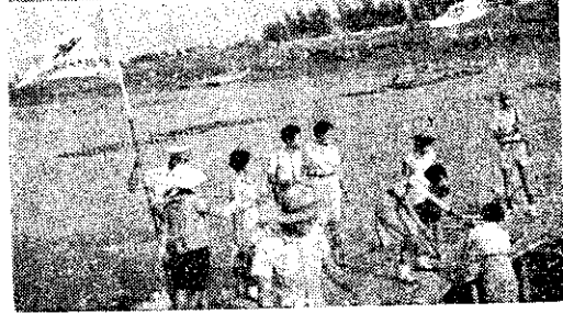
嘉義區學校聯合營