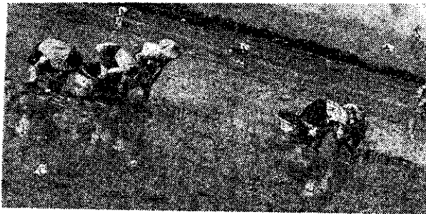
安南區洲西會友協助農友插秧