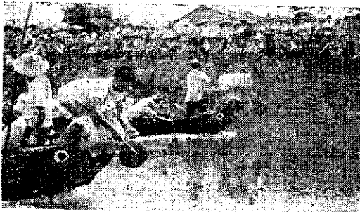
宜蘭龍舟競賽(張清界)