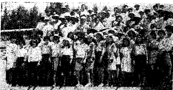
金門會友觀摩會前合影

及蘇澳等四鄉鎮四健會，為聯絡會員友誼，增進情感交流，特舉辦划龍船競賽，結果冠軍羅東，亞軍五結，並獲頒獎鼓勵。(張清界)