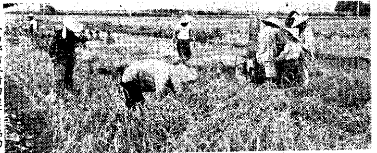
冬山鄉柯林村四健會員協助農友割稻(邱奕添)