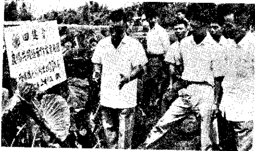
西螺鎮鹿場里林義指導員農場共同經營作業情形(柏)