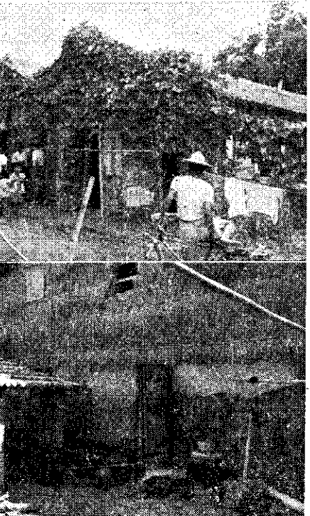
(上) 洋菇舍不宜和住家相鄰 (下) 菇舍應避免和葡萄舍近 (阮國琛)

該中心的業務，包括農耕機整地、作畦、挖甘藷、抽水和動力微粒噴藥等作業。此外，並將協助農友貸款購買和保養護農機具；供應有關農機具的資料和加強廠商與農友間的聯繫，舉辦專業訓練和講習示範等工作。