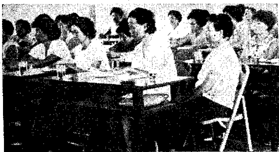
南州家政人員講習(林抄)

臺南縣佳里鎮參加五十六年春季落花生增產競賽，業經省府核定，獲得全省第一名。品種是「臺南九號」，每公頃落花生乾莢產量達一〇、四一六公斤，剝乾仁五、三五〇公