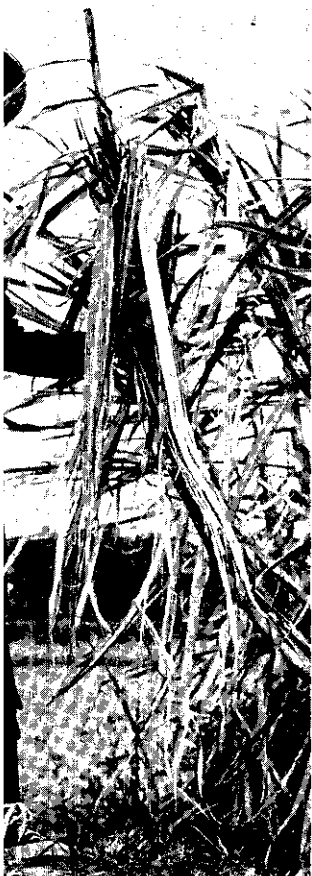
幫助父兄在田地裏工作