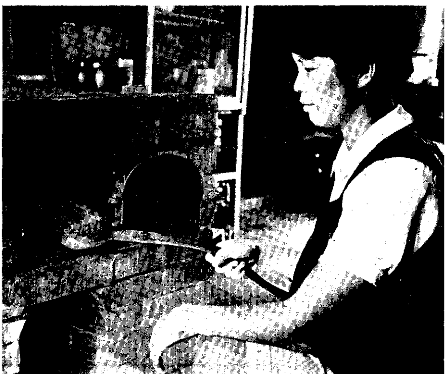
。政家善改·婦主家農個一做