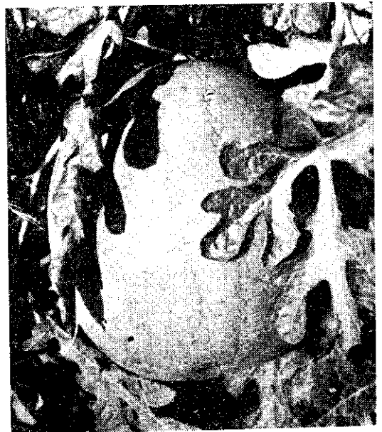
光 富 新