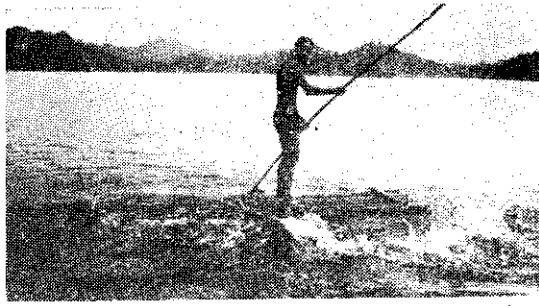
民農畜牧二郊遊—划竹筏

牧班，為消除開學以來緊張的情緒，欣賞野外美耀風光，藉以發揮合羣友愛精神，特於上（十）月七日由嘉義縣政府前集合出發，前往「白河水庫」郊遊。 一路上同學們歡聲悠揚，喜樂融融，到達目的地後，便舉行釣魚比賽，及康樂活動：有唱歌、說笑話、划竹筏……等，相當精彩，直至夕陽西下，才一路盡興歸回，結束這次有意義的郊遊。 （駱鈴）