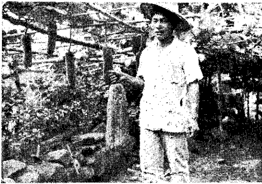
一分努力一分收穫： 高雄縣桃源鄉桃源村三十八號顏章 農友種的絲瓜(菜瓜)