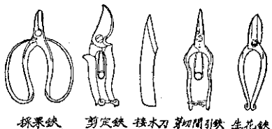
採果鉤 剪定鉤 接木刀 第四開引鉤 生花鉤