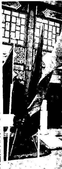
參觀桃園土地改革陳列館

專家學者四十餘人。會中除權威性專題報告外，並討論臺灣現況及其土地改革對於開發中國家之適用可能性。與會人士曾赴本省各地參觀土地改革成果及土地重劃情形。