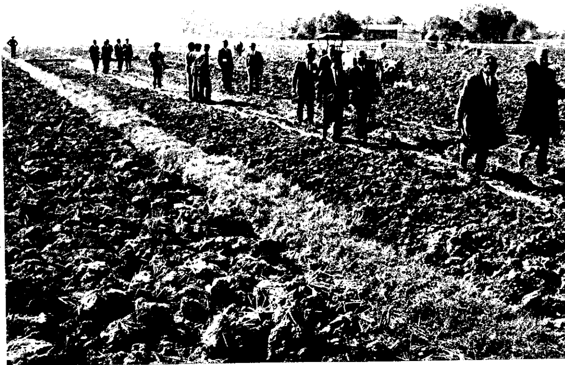
參觀高雄土地重劃實況