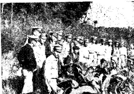
員林農校學生參觀農場

秧田的益處，特利用上課時間指導五年乙班學生實習。古人說：「流汗播種，歡呼收穫」。故欲使水稻產量提高，必須育成健全秧苗。(翁文秀)