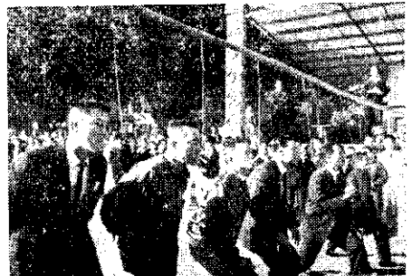
臺中高農運動會家長點煙比賽(湖中)

一年級全部到中興大學。綜合農業科二年級到東勢農林廳種苗繁殖場，三年級到臺中農業改良場，園藝科二、三年級到嘉義農業試驗所。畜牧科二年級到臺中市畜牧分場，三年級新化畜牧試驗所。加工科二年級溪湖糖廠，三年級臺中酒場。家事科二、三年級到南投省政資料館。(藍文、陳進明、陳有仁)