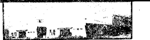
成長中的正豐農藥 圖為與世界農化總局 PHILIPS-DUPHAR 合作，佔地廣遠萬餘坪的正豐二廠全自動設備粉粒劑部門興建中一瞥