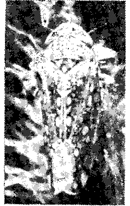
圖二：南斑浮塵子成蟲