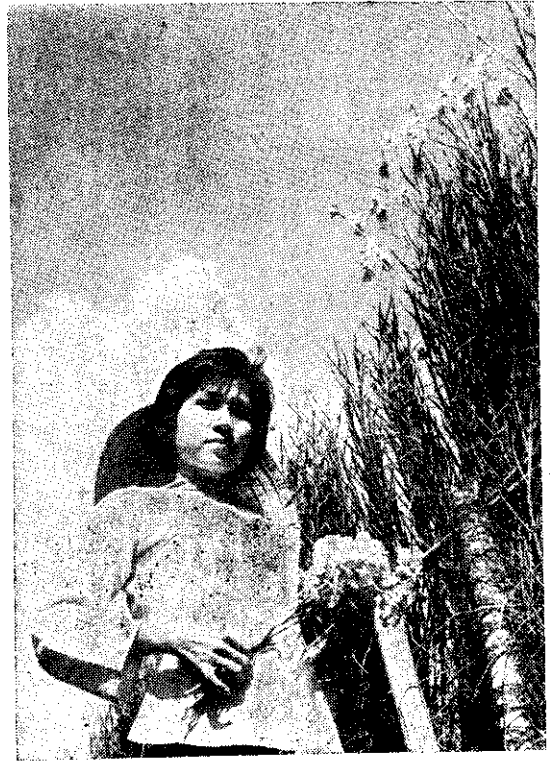
(供提職崇劉) 蘭代萬生野的南越