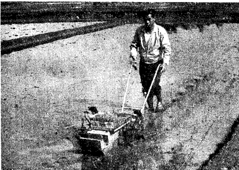
機秧插稻水式推手的良設計設場良政業農區北臺

臺灣省水產試驗所研究試驗用人工混合飼料養蝦，第一期試驗的結果非常良好，養蝦及蝦苗對人工混合飼料順利攝食，水試所的高雄及臺南分所將繼續進行第二期試驗工作。 水試所表示：臺灣過去多以下雜魚作為養蝦飼料，很容易腐化，消耗量也大。目前試驗中的人工混合飼料是乾燥的，容易儲藏，營養價值高。將繼續降低成本以便大量推廣。