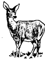
鹿肉據說甚為滋補，公鹿幼角鹿茸，在中藥店買得很好的價錢。鹿一般可分梅花鹿與水鹿，水鹿價格較高，滿一歲者一對三萬元。雌性水鹿多牛在春秋發情，雌性發情持續期間為二十至六十小時，一般發情的徵候並不明顯。

準相差過多時，就需要調整。從臺北區酪農飼養管理上，可用下列方法，使含脂率提高： (1) 少給豆腐渣，增加青草或乾草量，每頭乳牛每天需八十至一百臺斤左右的青草。 (2) 飼料中減少火草或紫雲英等多汁青草，增加雜草或牧草量。 (3) 濃厚飼料中加椰子粕，同時，減少飼料中的米糠或麸皮量，椰子粕可以提高牛乳的脂肪。 (4) 乳牛乳房有病，需予治療。 (宜) 宜陳市凱旋路三十五號石高地農友來信詢及牛乳含脂率調整問題，請參看本文。