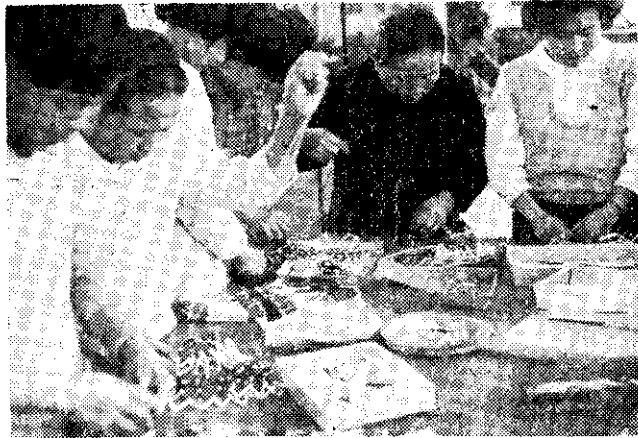
手工藝班學員製玉彩袋

光復二十餘年來的臺灣，保持着以農作物生產為主業的農業經濟。一般人都認為水稻、雜糧或其他作物的生產為農家的主業，而把畜牧生產或其他農家作業當做農家的副業，但事實上有些農家是以畜牧生產為主業的。因此農家主業的分別，應以某種生產的收入佔農家總收入比例的大小而定。就農村副業本身性質來說，可分為：(一)植物生產副業，(二)動物生產副業，(三)農產加工副業，(四)手工藝副