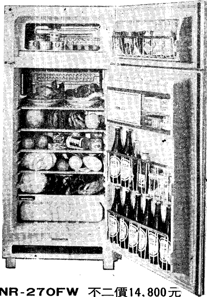
〈双門式〉 NR-270FW 不二價14,800元