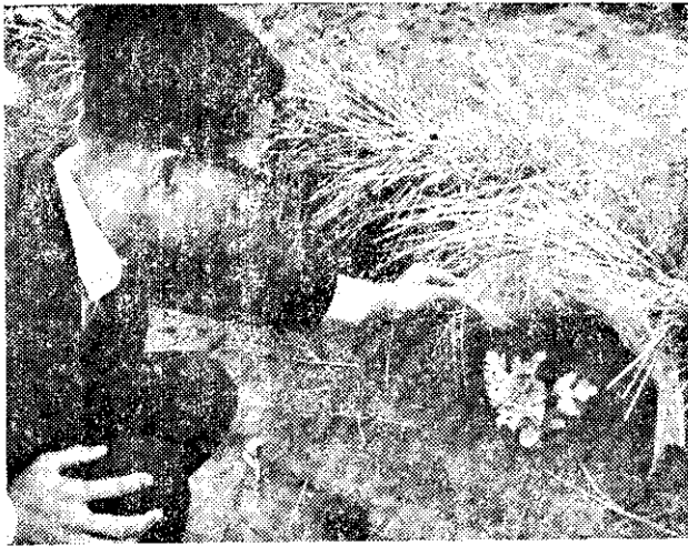
形情好良育生苗瓜西下罩溫保形方長

(1)：由二張四邊各為四十公分長的平行四邊形薄膜所構成。甲乙和丙丁二邊是粘口的。頂角乙約為一百一十度，其附近穿有直徑八分之一吋，間隔三公分之小孔八至十二個，以利通風換氣。使用此種保溫罩時，將甲丁兩底邊張開，以三十公分長的小竹枝支持乙點而罩於西瓜植株上，與地面接觸之處並覆以砂土，即成爲圓錐形的小帽罩。因爲這是四周密閉的，所以保溫效果較好。 (2)長方形保溫罩(圖二)：將長度五十五公分，寬度三十八公分